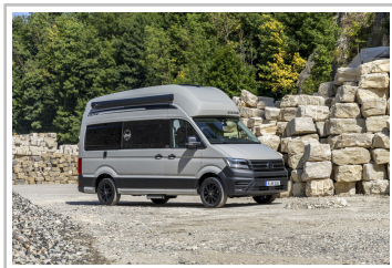
VW Grand California 600 Dune.