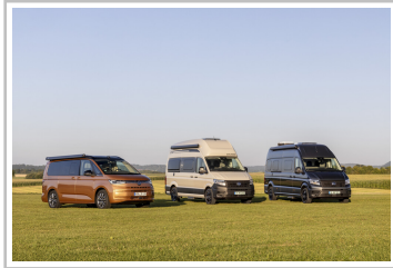
Reisemobile von VW (von links): California, Grand California 600 und Grand California 680.