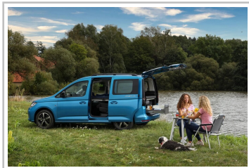
VW Caddy California.