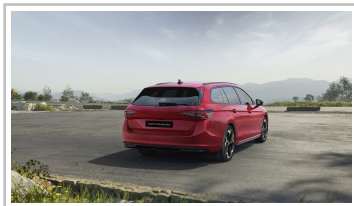
Skoda Superb Combi Sportline.