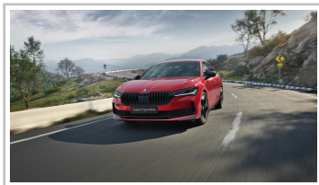
Skoda Superb Sportline.