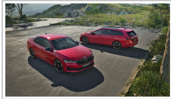
Skoda Superb Sportline.