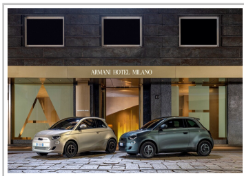
Fiat 500 Elektro Giorgio Armani Collector's Edition.