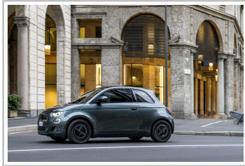
Fiat 500 Elektro Giorgio Armani Collector's Edition.