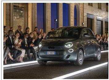
Fiat 500 Elektro Giorgio Armani Collector's Edition.