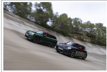
Mini JCW und JCW Aceman (l.).