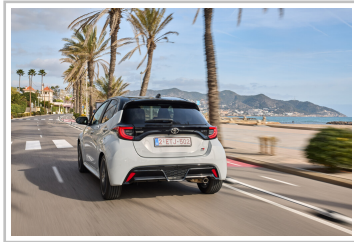
Toyota Yaris GR Sport.