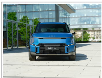
Kia EV9 GT-line.