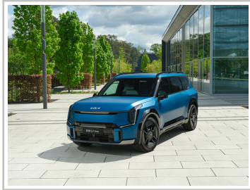
Kia EV9 GT-line.