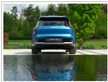
Kia EV9 GT-line.