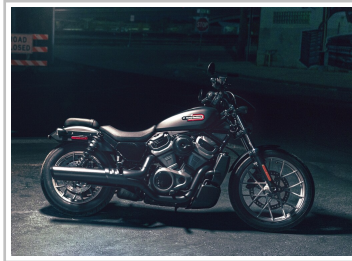
Harley-Davidson Nightster Special.