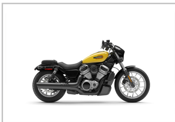
Harley-Davidson Nightster Special.