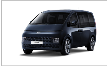
Hyundai Staria Prime.