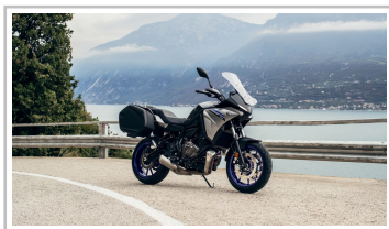
Yamaha Tracer 7 GT.