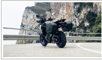
Yamaha Tracer 7 GT.