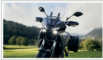
Yamaha Tracer 7 GT.