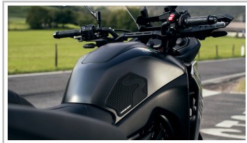
Yamaha Tracer 7 GT.