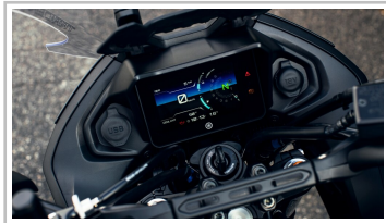
Yamaha Tracer 7 GT.