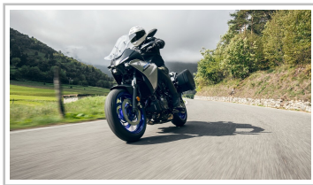
Yamaha Tracer 7 GT.