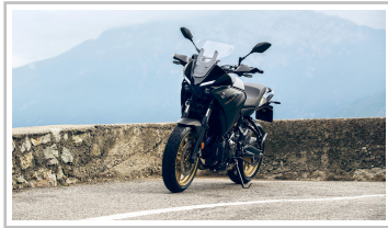
Yamaha Tracer 7.