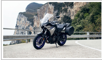
Yamaha Tracer 7 GT.