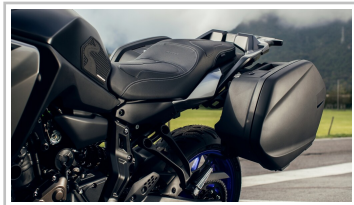
Yamaha Tracer 7 GT.