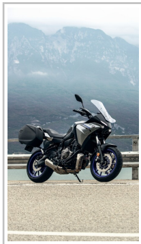
Yamaha Tracer 7 GT.