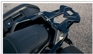
Yamaha Tracer 7 GT.