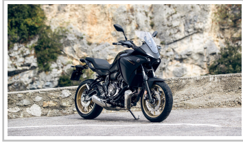
Yamaha Tracer 7.