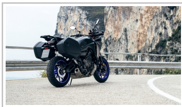
Yamaha Tracer 7 GT.