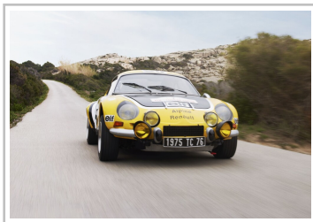
Alpine A 110 in der Ausführung der Korsika-Rallye 1975.