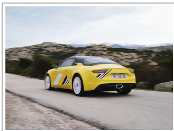
Alpine A110, Sondermodell „Tour de Corse 75“.