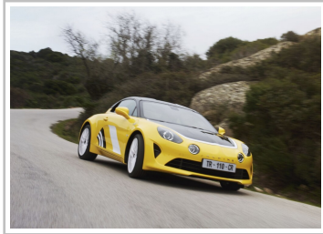
Alpine A110, Sondermodell „Tour de Corse 75“.