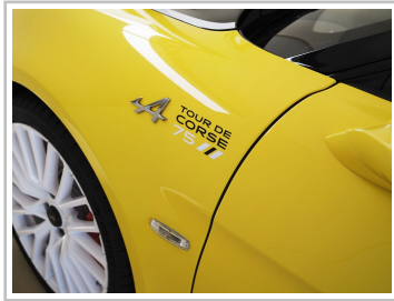
Alpine A110, Sondermodell „Tour de Corse 75“.