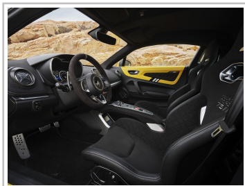
Alpine A110, Sondermodell „Tour de Corse 75“.