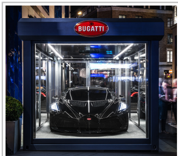
Bugatti "La Voiture Noire" am Londoner Leicester Square.