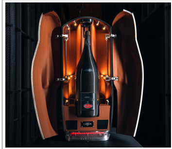
Bugatti-Champagnerflasche „La Bouteille Noire“.