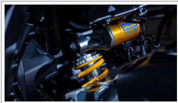
Yamaha MT-10 SP.