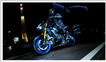
Yamaha MT-10 SP.