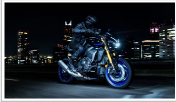
Yamaha MT-10 SP.