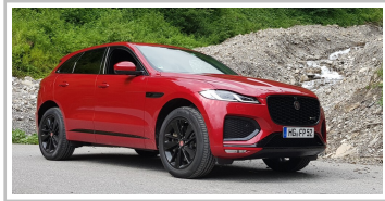
Jaguar F-Pace D300 AWD.