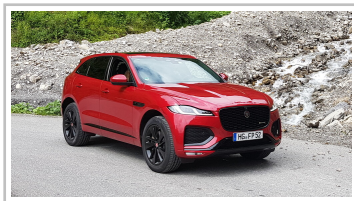
Jaguar F-Pace D300 AWD.