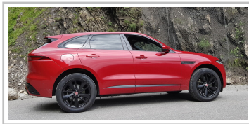
Jaguar F-Pace D300 AWD.