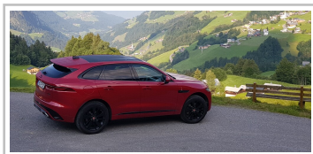
Jaguar F-Pace D300 AWD.