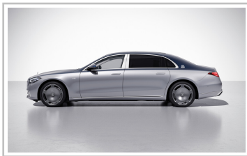
Mercedes-Maybach S 680 4Matic „Edition 100“