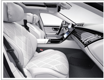
Mercedes-Maybach S 680 4Matic „Edition 100“