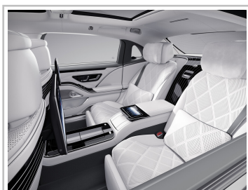
Mercedes-Maybach S 680 4Matic „Edition 100“