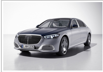
Mercedes-Maybach S 680 4Matic „Edition 100“