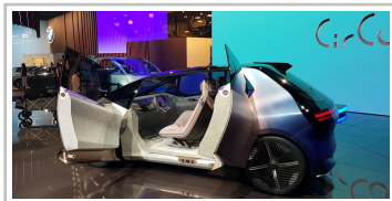
BMW i Vision Circular.