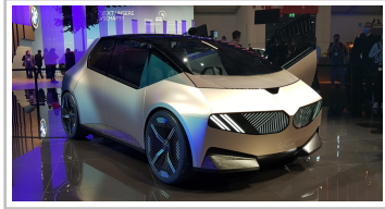
BMW i Vision Circular.