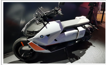
BMW Concept CE 02.