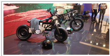
BMW Motorrad Vision Amby und BMW Pedelec i Vision Amby.