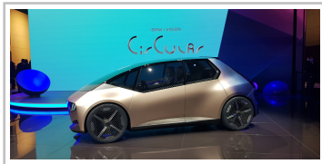
BMW i Vision Circular.