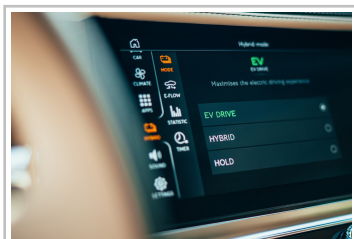
Bentley Flying Spur Hybrid.