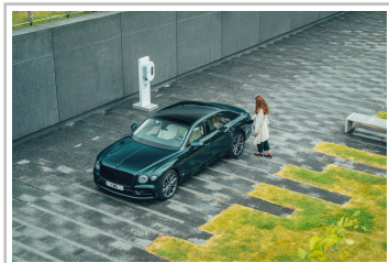
Bentley Flying Spur Hybrid.