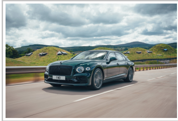
Bentley Flying Spur Hybrid.