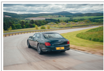
Bentley Flying Spur Hybrid.