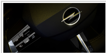
Opel Astra (Baureihengeneration L).