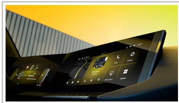
Opel Astra (Baureihengeneration L).