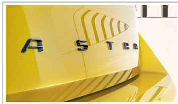
Opel Astra (Baureihengeneration L).