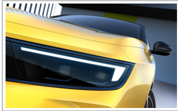
Opel Astra (Baureihengeneration L).