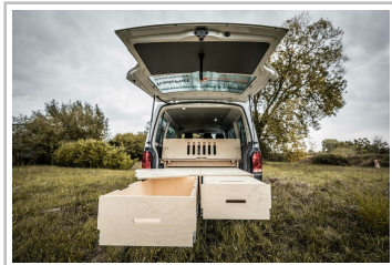
Campingeinbauten von Hornbach.