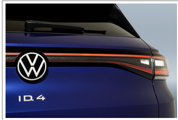
Volkswagen ID 4.