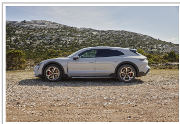
Porsche Taycan Cross Turismo.