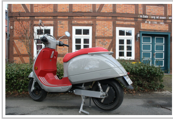
Kumpan 54 Ignite.