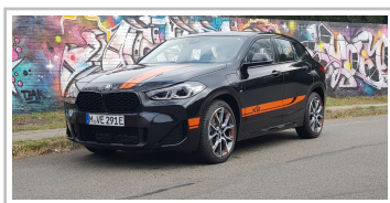
BMW X2, Sondermodell „M Mesh Edition“.