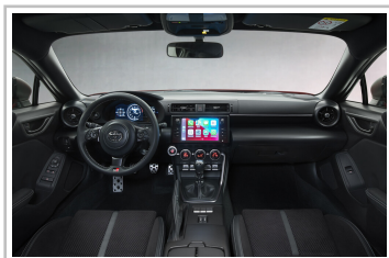
Toyota GR 86.