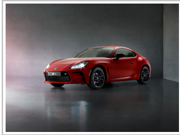
Toyota GR 86.