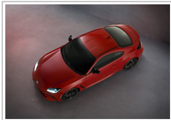
Toyota GR 86.