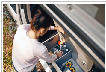
Opel Zafira Crosscamp Life.