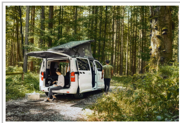
Opel Zafira Crosscamp Life.