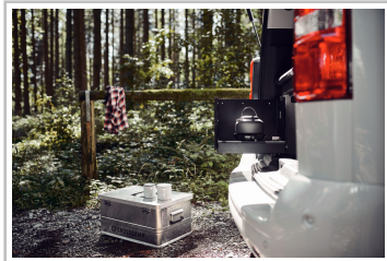
Opel Zafira Crosscamp Life.