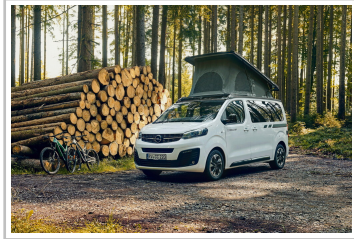
Opel Zafira Crosscamp Life.