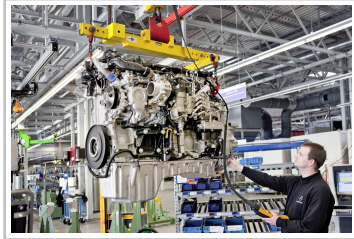
Motorenfertigung im Mercedes-Benz-Werk Mannheim (Archivbild).