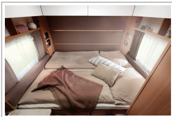
LMC Style 400 F.