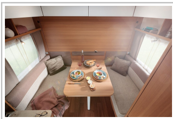
LMC Style 400 F.