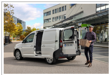
VW Caddy Cargo.