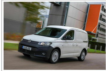
VW Caddy Cargo.