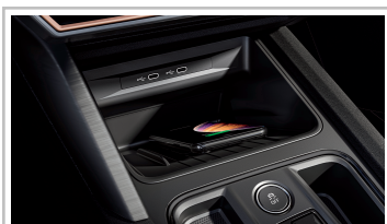
Cupra Formentor 1.5 TSI.