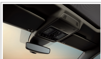
Cupra Formentor 1.5 TSI.