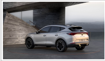
Cupra Formentor 1.5 TSI.