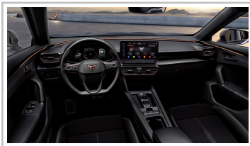
Cupra Formentor 1.5 TSI.