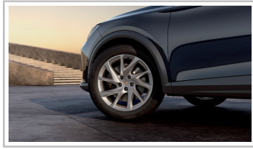
Cupra Formentor 1.5 TSI.