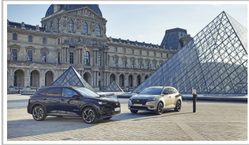
Citroen DS 7 Crossback Louvre.