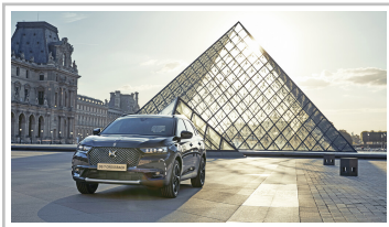
Citroen DS 7 Crossback Louvre.