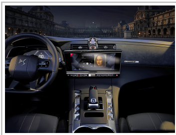
Citroen DS 7 Crossback Louvre.