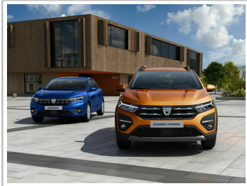
Dacia Sandero und Sandero Stepway.