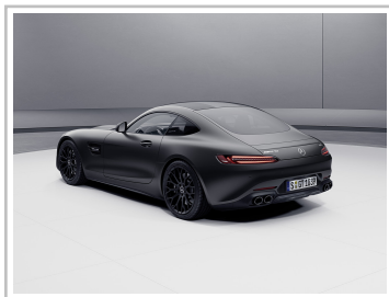
Mercedes-AMG GT Roadster Night Edition.