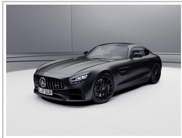
Mercedes-AMG GT Roadster Night Edition.