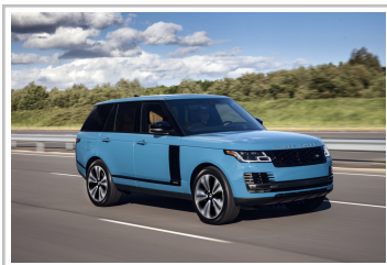
Range Rover Fifty.