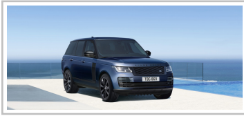
Range Rover Westminster Black.