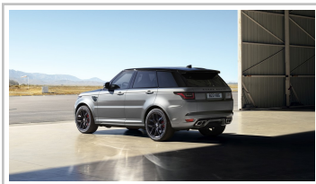
Range Rover Sport SVR Carbon Edition.