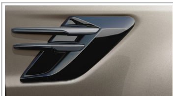
Range Rover Sport HSE Silver.