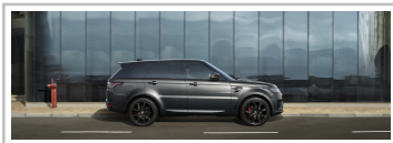
Range Rover SV Autobiography Dynamic Stealth.