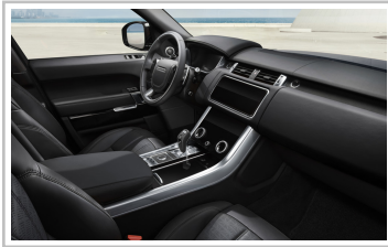
Range Rover Sport HSE Dynamic Stealth Silver.