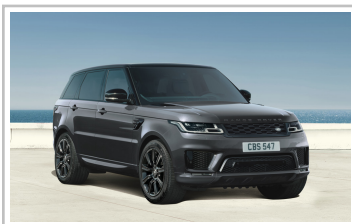
Range Rover Sport HSE Dynamic Stealth Silver.