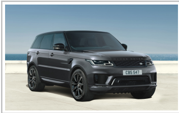
Range Rover SV Autobiography Dynamic Stealth.