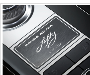
Range Rover Fifty.