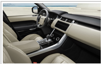
Range Rover Sport HSE Silver.