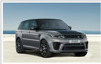
Range Rover Sport SVR Carbon Edition.