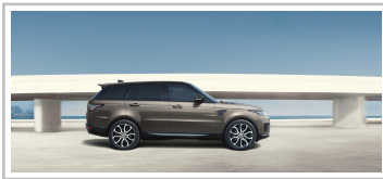
Range Rover Sport HSE Silver.