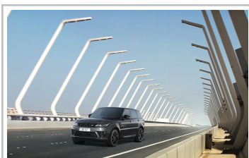
Range Rover Sport HSE Dynamic Stealth Silver.