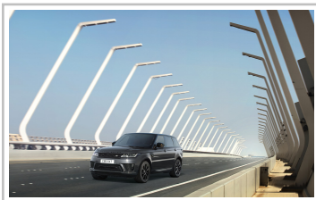
Range Rover SV Autobiography Dynamic Stealth.