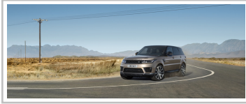
Range Rover Sport HSE Silver.