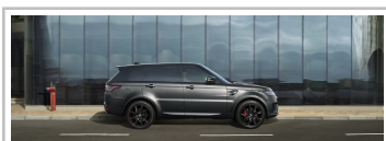
Range Rover Sport HSE Dynamic Stealth Silver.