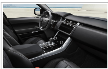
Range Rover SV Autobiography Dynamic Stealth.