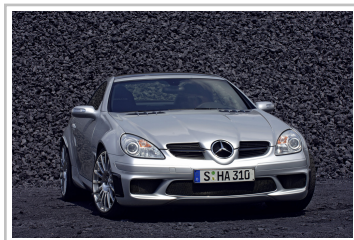
Mercedes-Benz SLK 55 Black Series (2006).