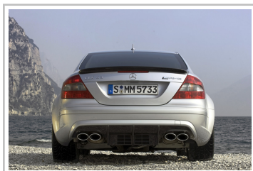
Mercedes-Benz CLK 63 AMG Black Series (2007–2008).