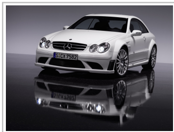
Mercedes-Benz CLK 63 AMG Black Series (2007–2008).