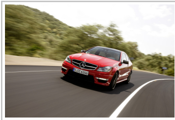
Mercedes-Benz C 63 AMG Coupé Black Series (2011).