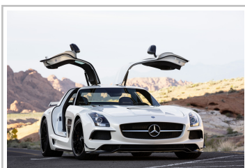
Mercedes-Benz SLS AMG Black Series (2013).