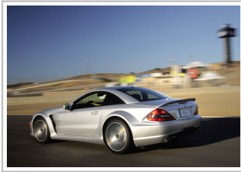
Mercedes-Benz SL 65 AMG Black Series (2008–2009).