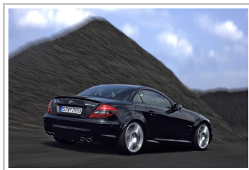
Mercedes-Benz SLK 55 Black Series (2006).