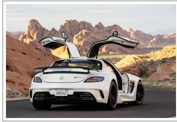
Mercedes-Benz SLS AMG Black Series (2013).