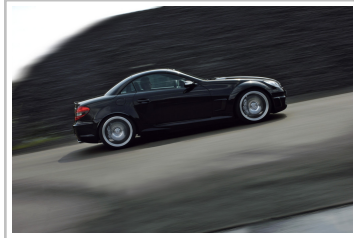
Mercedes-Benz SLK 55 Black Series (2006).