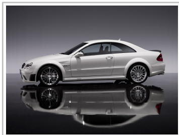
Mercedes-Benz CLK 63 AMG Black Series (2007–2008).