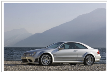
Mercedes-Benz CLK 63 AMG Black Series (2007–2008).