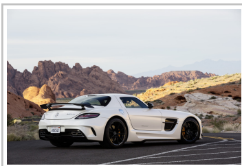
Mercedes-Benz SLS AMG Black Series (2013).