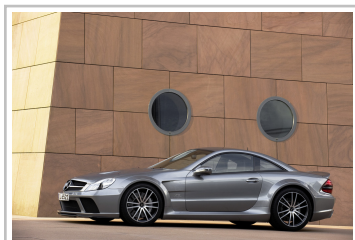
Mercedes-Benz SL 65 AMG Black Series (2008–2009).