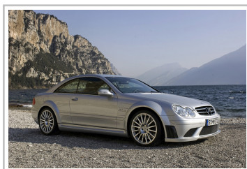
Mercedes-Benz CLK 63 AMG Black Series (2007-2008).