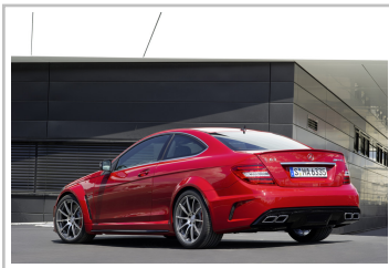
Mercedes-Benz C 63 AMG Coupé Black Series (2011).