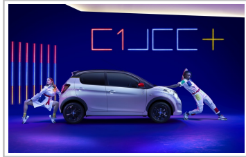
Citroën C1 JCC+.