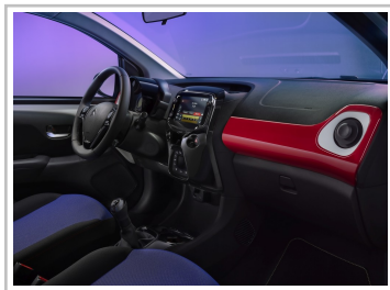
Citroën C1 JCC+.