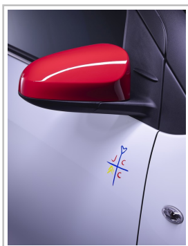
Citroën C1 JCC+.