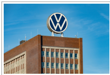
VW-Stammsitz in Wolfsburg.