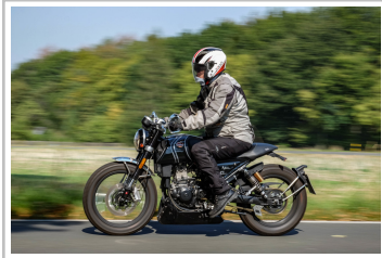
F.B Mondial HPS 300i.