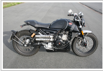
F.B Mondial HPS 300i.