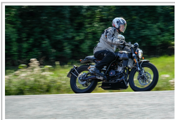
F.B Mondial HPS 300i.