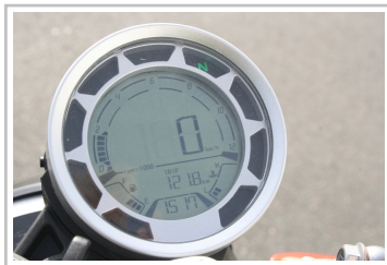
F.B Mondial HPS 300i.