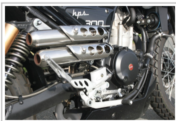
F.B Mondial HPS 300i.