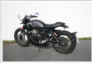
F.B Mondial HPS 300i.