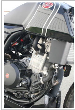
F.B Mondial HPS 300i.