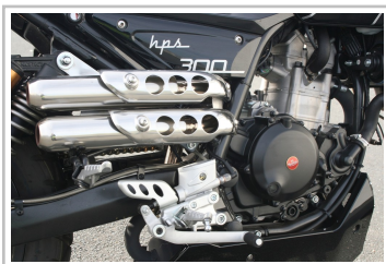
F.B Mondial HPS 300i.