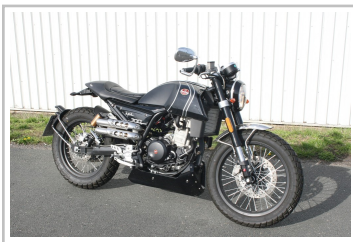
F.B Mondial HPS 300i.