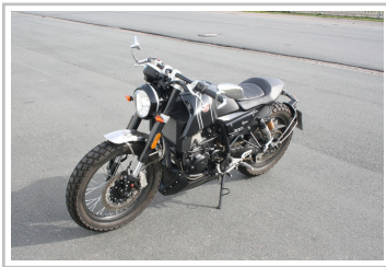
F.B Mondial HPS 300i.