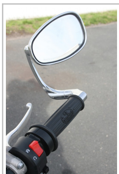
F.B Mondial HPS 300i.