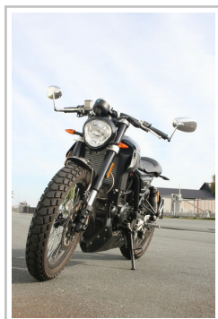
F.B Mondial HPS 300i.