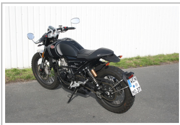
F.B Mondial HPS 300i.