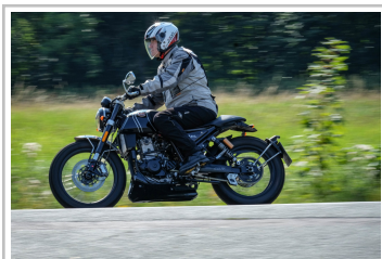
F.B Mondial HPS 300i.