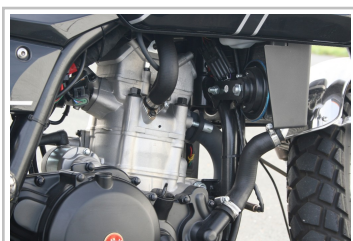
F.B Mondial HPS 300i.