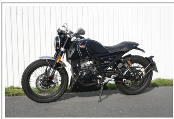
F.B Mondial HPS 300i.