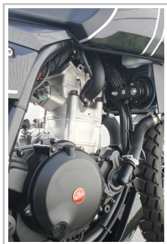
F.B Mondial HPS 300i.