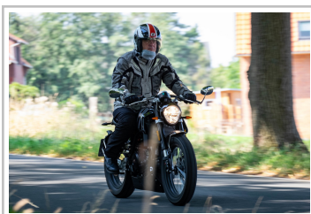
F.B Mondial HPS 300i.