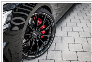
Audi S5 Sportback von Abt Sportsline.