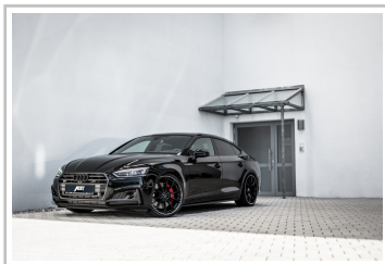
Audi S5 Sportback von Abt Sportsline.