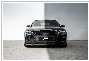
Audi S5 Sportback von Abt Sportsline.