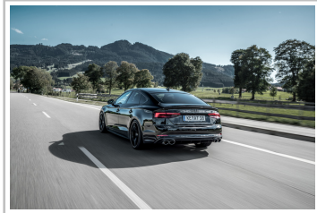
Audi S5 Sportback von Abt Sportsline.