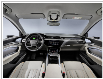
Audi e-Tron 50 Quattro.