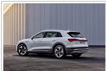
Audi e-Tron 50 Quattro.