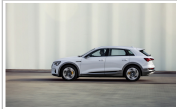
Audi e-Tron 50 Quattro.