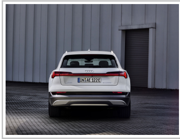
Audi e-Tron 50 Quattro.