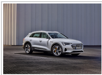
Audi e-Tron 50 Quattro.