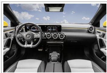
Mercedes-AMG CLA 35 4Matic Shooting Brake.