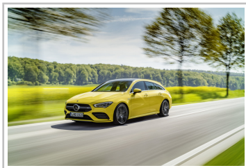
Mercedes-AMG CLA 35 4Matic Shooting Brake.