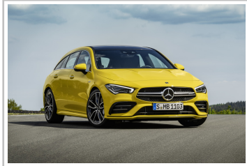
Mercedes-AMG CLA 35 4Matic Shooting Brake.