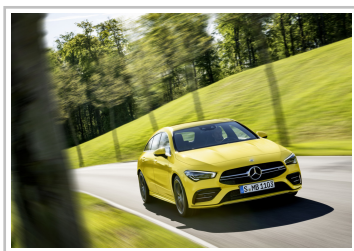
Mercedes-AMG CLA 35 4Matic Shooting Brake.