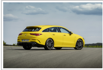
Mercedes-AMG CLA 35 4Matic Shooting Brake.