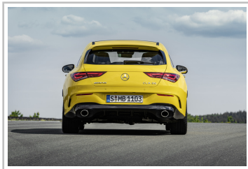
Mercedes-AMG CLA 35 4Matic Shooting Brake.