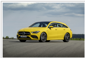
Mercedes-AMG CLA 35 4Matic Shooting Brake.