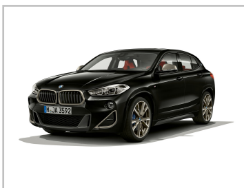
BMW X2 M35i.