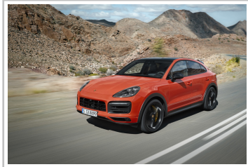
Porsche Cayenne Coupé.