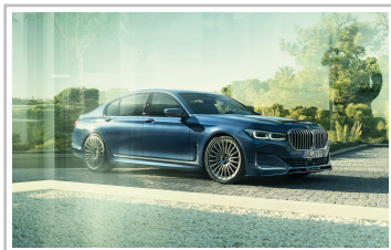
BMW Alpina B7.