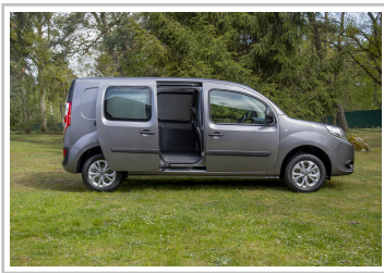
Nissan NV250 L2 Kastenwagen.