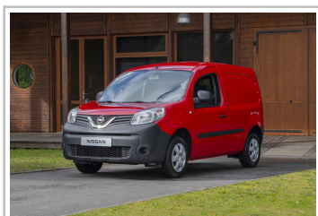
Nissan NV250 L1 Kastenwagen.