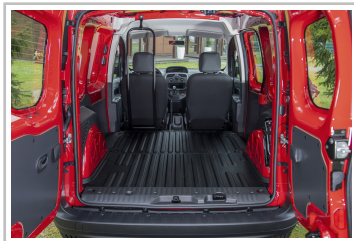
Nissan NV250 L1 Kastenwagen.