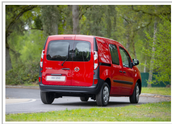
Nissan NV250 L1 Kastenwagen.