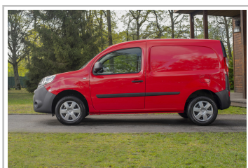
Nissan NV250 L1 Kastenwagen.