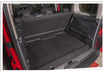
Nissan NV250 Kombi L1.