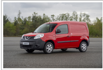
Nissan NV250 L1 Kastenwagen.