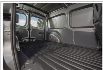
Nissan NV250 L2 Kastenwagen.