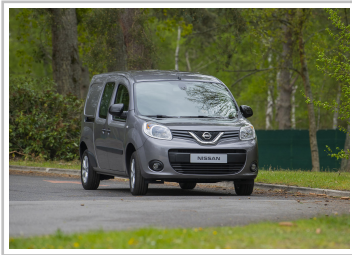
Nissan NV250 L2 Kastenwagen.