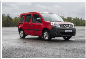
Nissan NV250 Kombi L1.