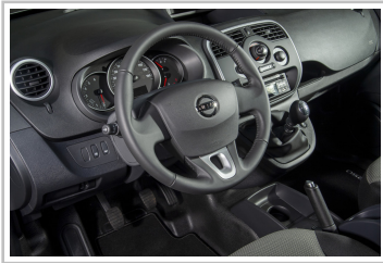
Nissan NV250 L2 Kastenwagen.