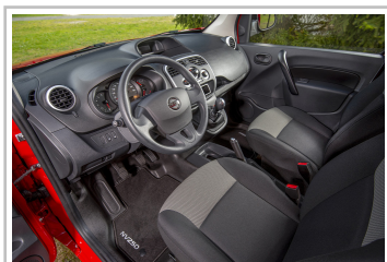
Nissan NV250 L1 Kastenwagen.