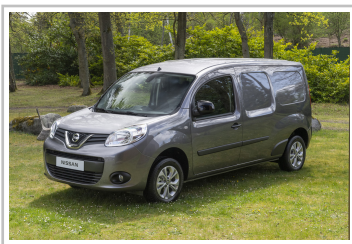
Nissan NV250 L2 Kastenwagen.