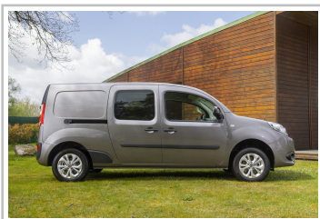
Nissan NV250 L2 Kastenwagen.