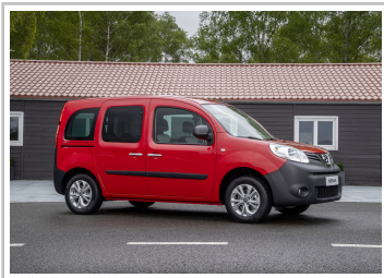
Nissan NV250 Kombi L1.