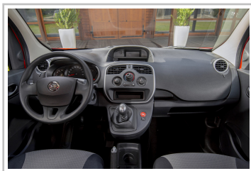
Nissan NV250 L1 Kastenwagen.