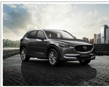
Mazda CX-5 Kangei.