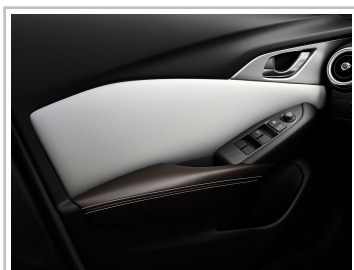
Mazda CX-3 Kangei.