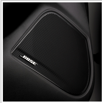
Mazda CX-3 Kangei.