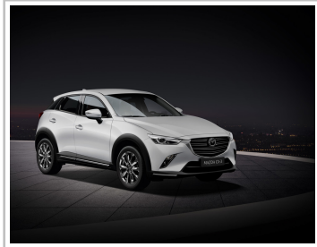
Mazda CX-3 Kangei.