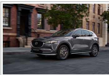
Mazda CX-5 Kangei.