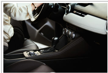
Mazda CX-3 Kangei.