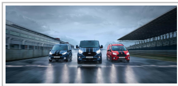
Ford Transit Sport-Modelle.