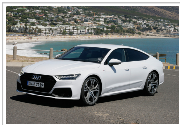
Audi A7 Sportback.