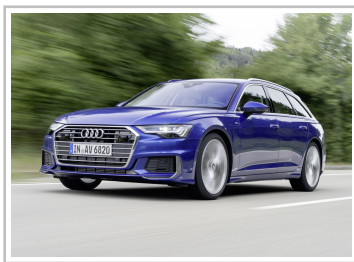
Audi A6 Avant.