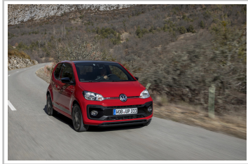
VW Up GTI.