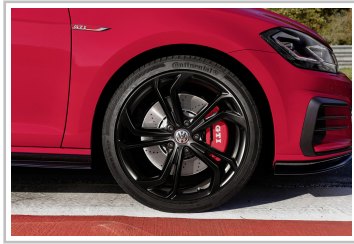
Volkswagen Golf GTI TCR.