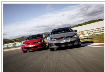
Volkswagen Golf GTI TCR.