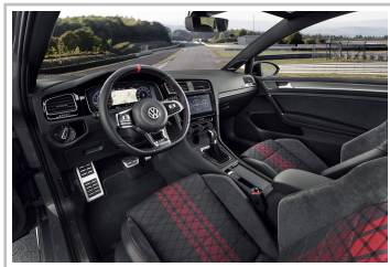
Volkswagen Golf GTI TCR.