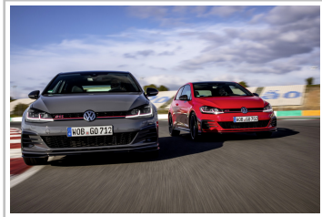
Volkswagen Golf GTI TCR.