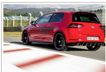
Volkswagen Golf GTI TCR.