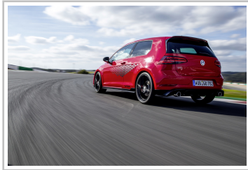
Volkswagen Golf GTI TCR.