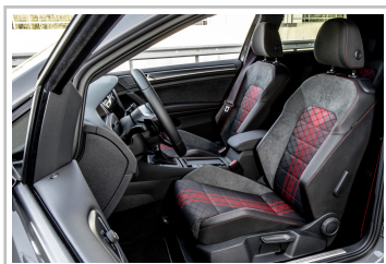
Volkswagen Golf GTI TCR.