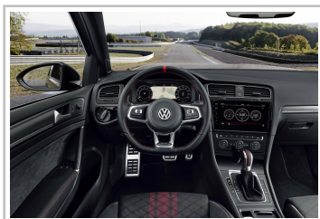
Volkswagen Golf GTI TCR.