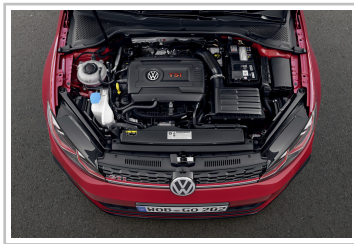
Volkswagen Golf GTI TCR.