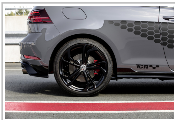
Volkswagen Golf GTI TCR.