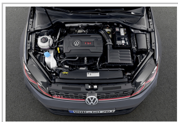
Volkswagen Golf GTI TCR.