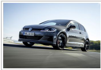
Volkswagen Golf GTI TCR.