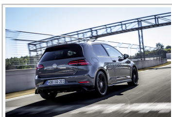
Volkswagen Golf GTI TCR.