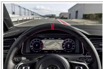
Volkswagen Golf GTI TCR.