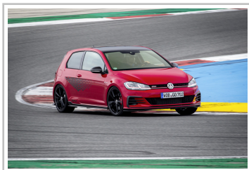
Volkswagen Golf GTI TCR.