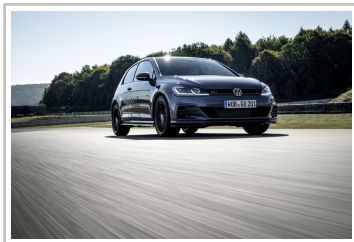
Volkswagen Golf GTI TCR.