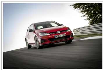
Volkswagen Golf GTI TCR.