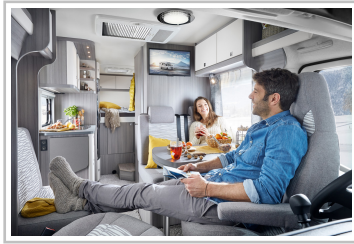
Hobby Optima Ontour V65 GF.