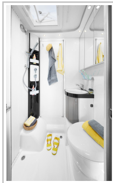
Hobby Optima Ontour V65 GF.