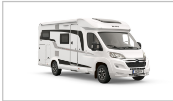
Hobby Optima Ontour V65.