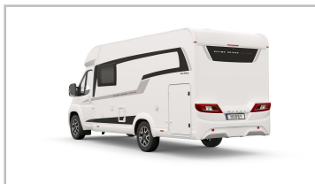
Hobby Optima Ontour V65.