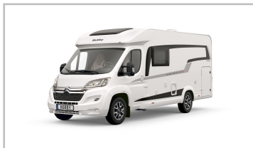
Hobby Optima Ontour V65.