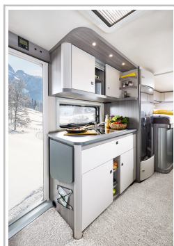
Hobby Optima Ontour V65 GE.