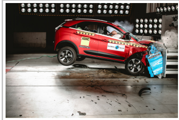
Tata Nexon im Global-NCAP-Crashtest.