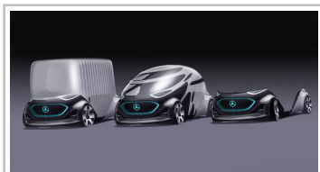
Mercedes-Benz Vans "Vision Urbanetic": Die Fahrzeugfamilie - bis jetzt.