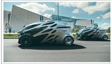
Mercedes-Benz Vans "Vision Urbanetic".