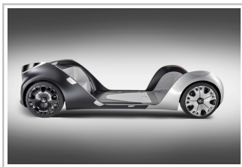
Mercedes-Benz Vans "Vision Urbanetic": Das "Skateboard".