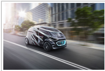
Mercedes-Benz Vision Urbanetic People-Mover-Modul.