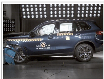
BMW X5 im Euro-NCAP-Crashtest.