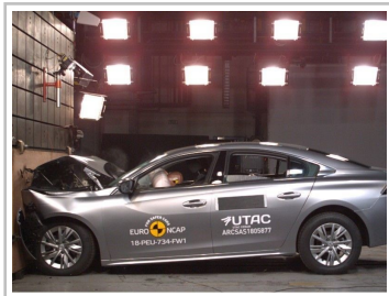
Peugeot 508 im Euro-NCAP-Crashtest.