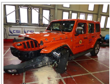
Jeep Wrangler im Euro-NCAP-Crashtest.