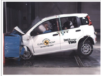
Fiat Panda im Euro-NCAP-Crashtest.