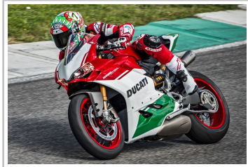
Ducati 1299 Panigale R Final Edition.