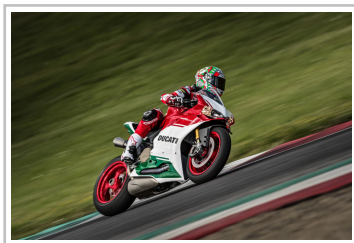
Ducati 1299 Panigale R Final Edition.