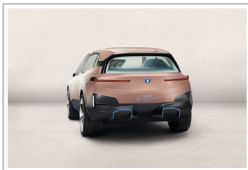
BMW Vision i-Next.