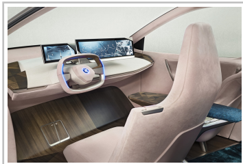
BMW Vision i-Next.