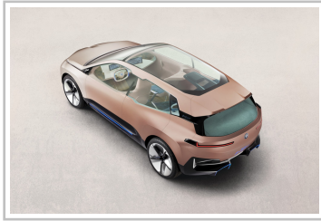
BMW Vision i-Next.