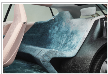
BMW Vision i-Next.