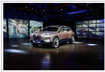
BMW Vision i-Next.