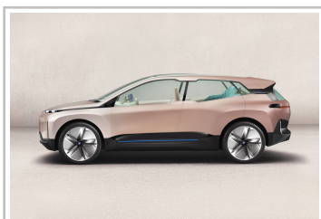
BMW Vision i-Next.