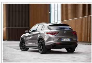
Alfa Romeo Stelvio B-Tech.