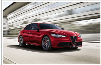
Alfa Romeo Giulia Veloce Ti.