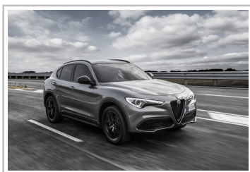
Alfa Romeo Stelvio B-Tech.