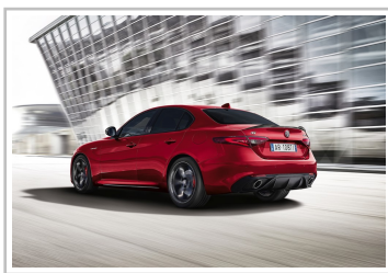
Alfa Romeo Giulia Veloce Ti.