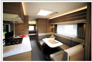
Adria Adora 673 PK.