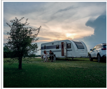
Adria Adora 673 PK.