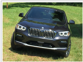
BMW X4 30i.