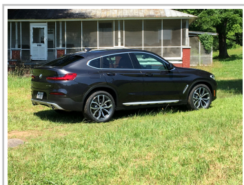
BMW X4 30i.