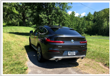
BMW X4 30i.