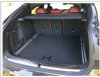
BMW X4 30i.