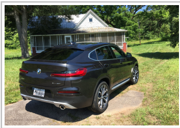
BMW X4 30i.