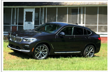
BMW X4 30i.