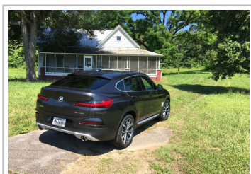
BMW X4 30i.