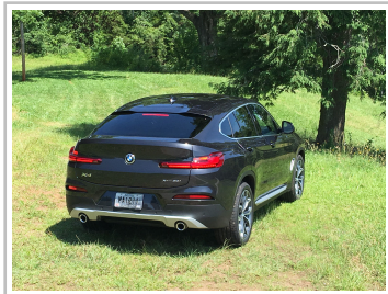
BMW X4 30i.